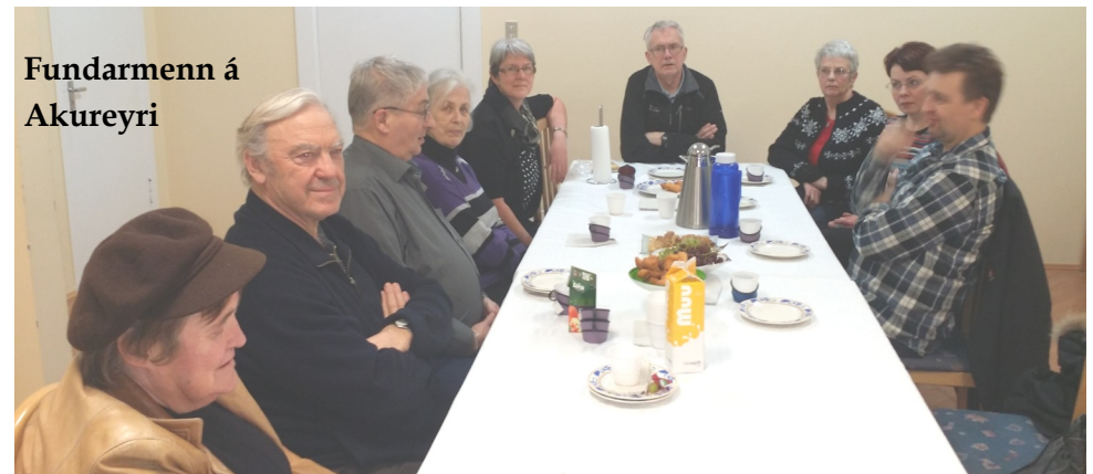
Fundarmenn á Akureyri

Efni: 10 km. hlaupið Gjafir til Landspítala Kviðskilun AÐALFUNDURINN